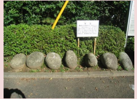
下総松崎そばの踏切手前にあった (なりた道)