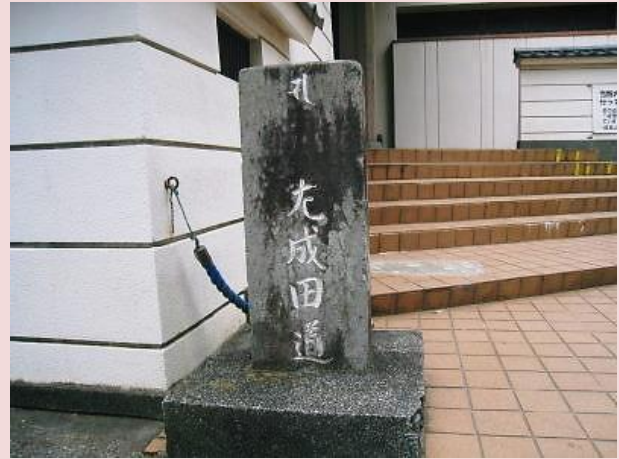
世稻荷前 輪宝付道標