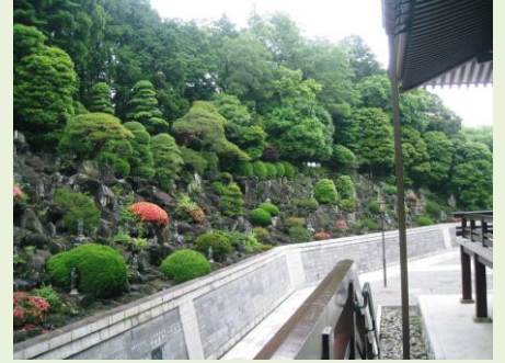
中央には不動明王と脇侍