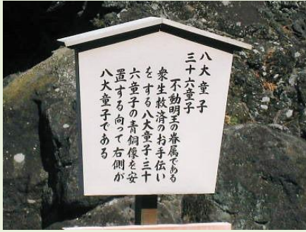
八大童子と三十六童子