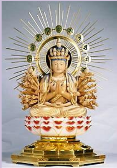
成田山新勝寺（手は 42 本）