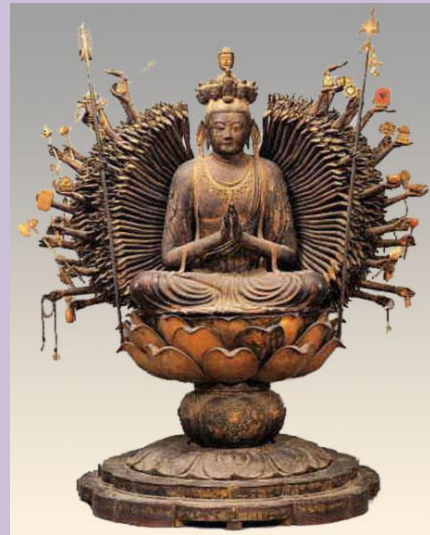
大阪の葛井寺（手は 1,039 本）