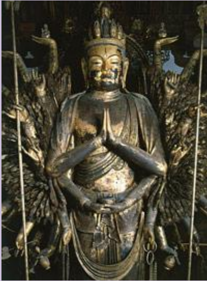
奈良 唐招提寺 （とうしょうだいじ） 奈良唐招提寺の立像（国宝）

1000本の手を持つ千手観音像の傑作は、奈良唐招提寺、大阪葛井寺、京都寿寶寺にあります。