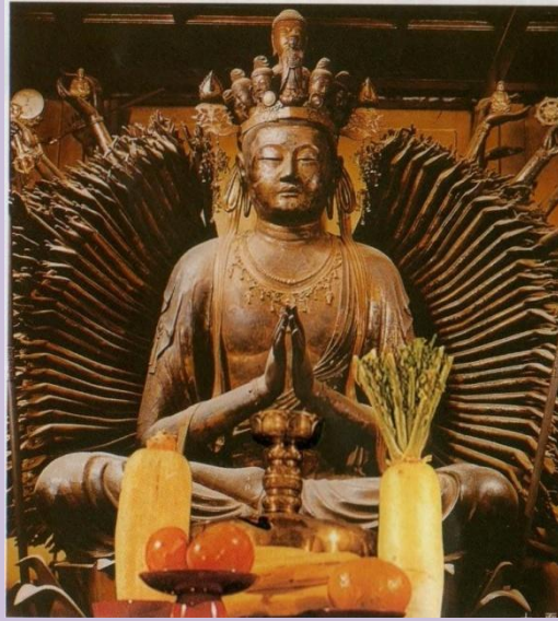
大阪の 葛井寺 （ふじいでら） 大阪府藤井寺市葛井寺の座像（国宝）