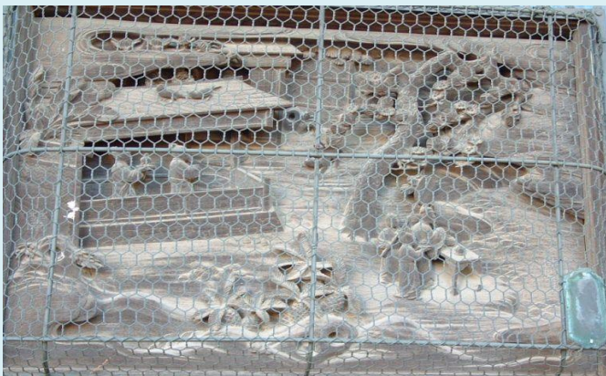
丁蘭 (二番目に彫る) 庾黔婁 無冠堂 嶋村俊表 刻銘 丁蘭の左下 主人公の名前もあるが彫刻の一部に彫っている。(下の写真参照)