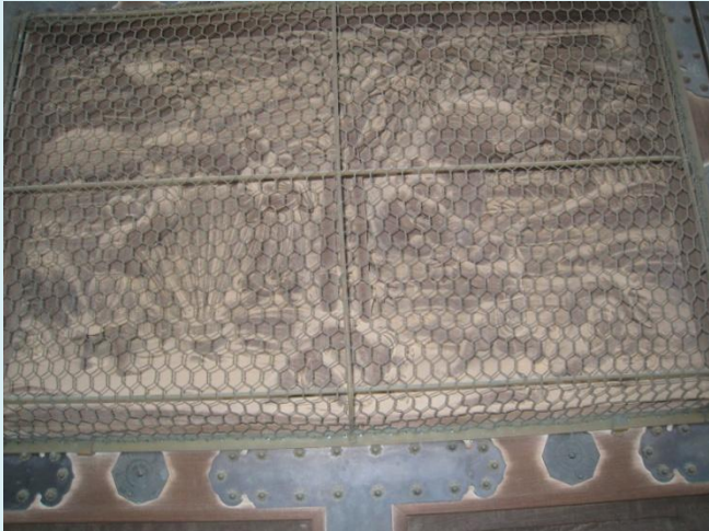
郭巨 (最初に彫る) 楊香 主人公の名前が無い